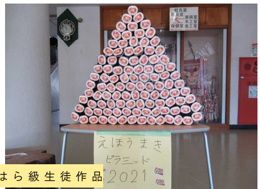
あいほら級生徒作品 2021

立春から雨水（うすい）、啓蟄（けいちつ）と季節がすすんだ頃に第39回卒業証書授与式が実施されます。それまで、まだまだ春とは名ばかりの寒い日が続きます。新型コロナウイルス感染症はもちろん、インフルエンザや風邪などの予防に細心の注意を払っていただきますようお願いいたします。